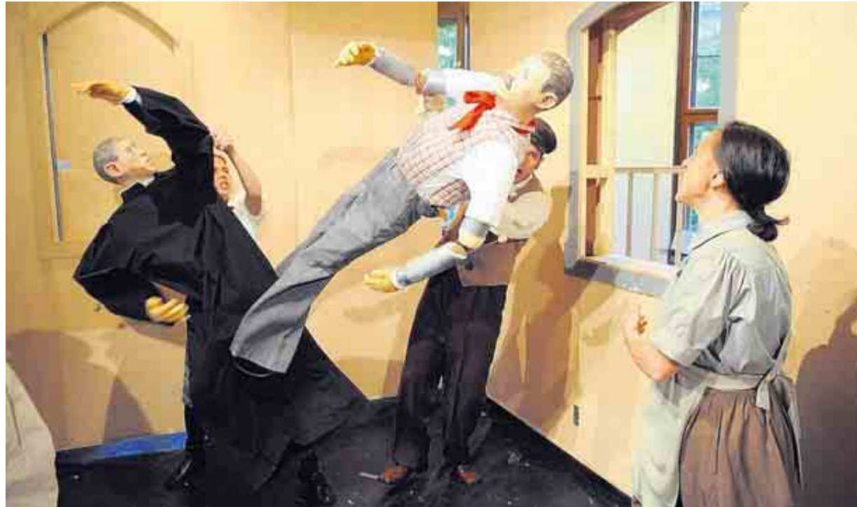
Kein Schädeltrauma erleiden Don Camillo und Peppone. Die Puppenköpfe halten den Zwist beider Figuren aus.