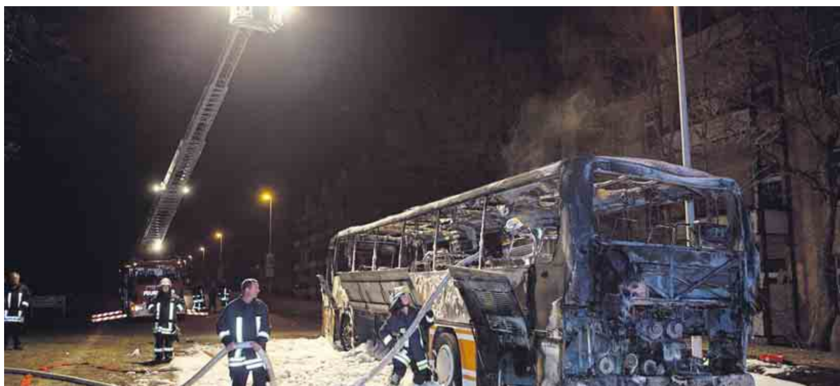
Den durch auslaufenden Dieselkraftstoff entfachten Brand konnten die Mitglieder der Freiwilligen Feuerwehr Naumburg nur durch massiven Einsatz von Schaum aus mehreren Löschfahrzeugen bekämpfen, der die Flammen bedeckte und schließlich erstickte.